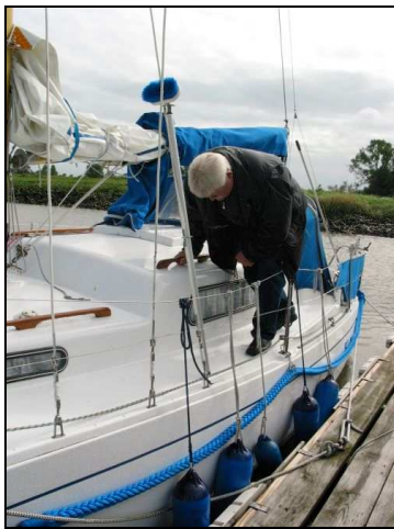
Abbildung 3: Standort des Verunfallten

Gegen 16:30 Uhr war die Yacht unter Großsegel und Motor auf der Elbe vor der Einfahrt Otterndorf. Nachdem die Rollfock eingeholt worden war, bereitete der Eigner das Niederholen des Großsegels vor. Der Mitsegler war am Ruder und der später Verunfallte befand sich an Bb.-Seite vom Baum (s. Abb. 3), um die dort befestigten Zeisinge zum Beschlagen des Großsegels loszumachen. Der Mitsegler kündigte auf Zuruf an, in den Wind zu drehen. Dabei schlug der Baum (s. Abb. 4) um und traf den Skipper so, dass er außenbords fiel, wo er durch Rufe und Winken auf sich aufmerksam machte.