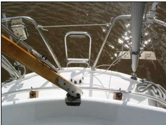
Abbildung 7: Hochgeklappte Pinne

Der Mitsegler machte durch Winken mit einer Segeljacke von der Plicht aus auf den Unfall aufmerksam (s. Abb. 7 und 8). Dabei musste die Pinne aus dem Weg geklappt werden. Die SY LEILA kam zu Hilfe, und der Mitsegler rief per Handy den Polizeiruf 110 an, weil die UKW-Anlage an Bord defekt gewesen sei. Die Mitsegler der LEILA versuchten, den Verunfallten, der bereits Schaum vor Mund und Nase hatte, vom Bug aus an Bord zu ziehen. Als dies misslang, wurden von der LEILA zwei rote Signale abgefeuert, und kurze Zeit später kam ein Boot der HALUNDER JET an die Unfallstelle, und es gelang, den Verunfallten ins Boot zu ziehen. Der Mitsegler der SY KLEINER LUMP informierte über Mobiltelefon die Feuerwehr in Cuxhaven. Der Notruf ging um 17:54 Uhr bei der Leitstelle ein. Danach fuhr er die SY KLEINER LUMP alleine unter Motor und mit Großsegel in den Hafen Altenbruch und machte dort fest.