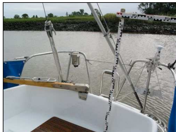
Abbildung 8: Pinne nach Hart Bb. gelegt

Inzwischen wurde der Seenotkreuzer HERMANN HELMS alarmiert. Das Tochterboot übernahm um 18:14 Uhr den Verunfallten. Die eingeleiteten Wiederbelebungsmaßnahmen auf dem Bereitschaftsboot der HALUNDER JET, dem Tochterboot der HERMANN HELMS sowie die Maßnahmen des Arztes auf dem Seenotkreuzer konnten das Leben des Skippers nicht mehr retten.