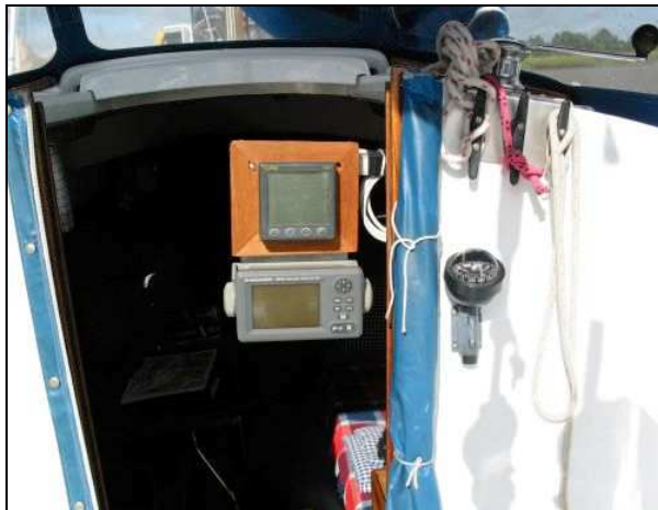
Abbildung 9: Navigationsausrüstung Plicht

Der 59-jährige Mitsegler ist langjähriger Wassersportler, seit 1977 im Besitz des Sportbootführerscheins See und zurzeit Besitzer einer Motoryacht. Beide Segler trugen während der Reise keine Rettungswesten. Navigiert wurde nach Sicht und mit einem GPS-Empfänger, Log und Echolot, einem eingehängten Peilkompass (s. Abb. 9 und Abb. 10), Elbe-Atlas und Hafenhandbüchern. Die UKW-Sprechfunkanlage sei am Unfalltag defekt gewesen. Bei der Besichtigung am nächsten Tag durch die Wasserschutzpolizei konnte zumindest Kanal 16 gehört werden.