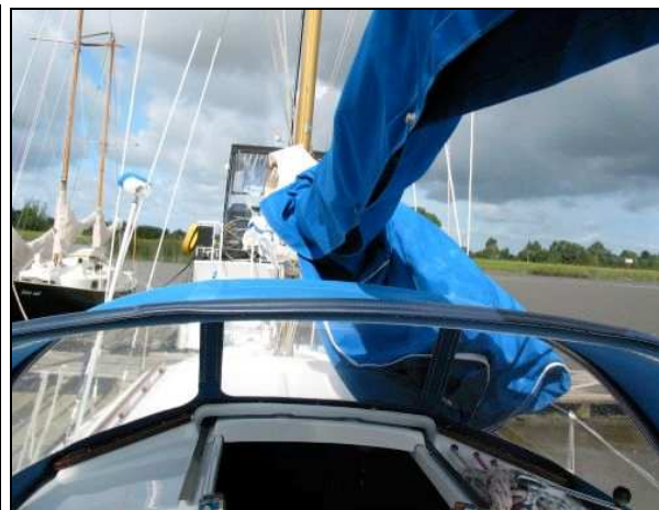
Abbildung 10: Sicht über die Sprayhood