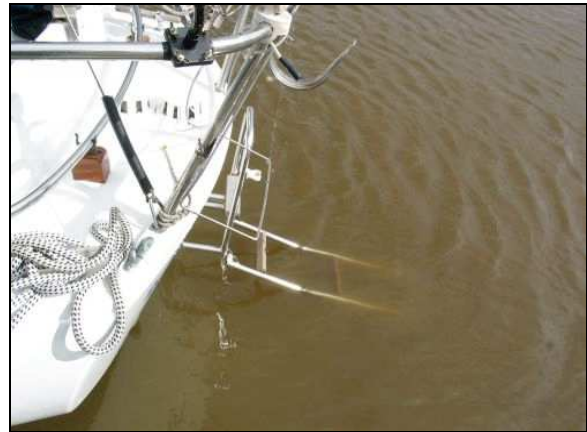
Abbildung 6: Bootsleiter Heck

Der Mitsegler machte durch Winken mit einer Segeljacke von der Plicht aus auf den Unfall aufmerksam (s. Abb. 7 und 8). Dabei musste die Pinne aus dem Weg geklappt werden. Die SY LEILA kam zu Hilfe, und der Mitsegler rief per Handy den Polizeiruf 110 an, weil die UKW-Anlage an Bord defekt gewesen sei. Die Mitsegler der LEILA versuchten, den Verunfallten, der bereits Schaum vor Mund und Nase hatte, vom Bug aus an Bord zu ziehen. Als dies misslang, wurden von der LEILA zwei rote Signale abgefeuert, und kurze Zeit später kam ein Boot der HALUNDER JET an die Unfallstelle, und es gelang, den Verunfallten ins Boot zu ziehen. Der Mitsegler der SY KLEINER LUMP informierte über Mobiltelefon die Feuerwehr in Cuxhaven. Der Notruf ging um 17:54 Uhr bei der Leitstelle ein. Danach fuhr er die SY KLEINER LUMP alleine unter Motor und mit Großsegel in den Hafen Altenbruch und machte dort fest.