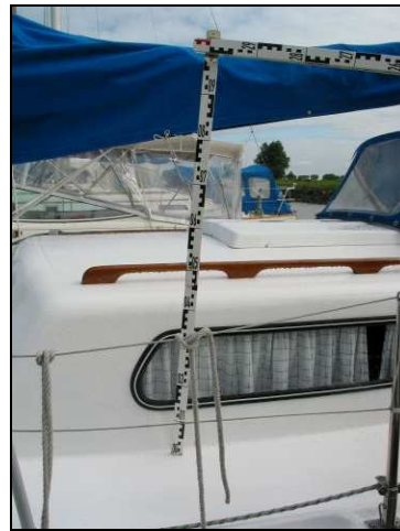
Abbildung 4: Baumhöhe

Der Mitsegler fuhr zwei Anlaufmanöver und versuchte, durch Wenden über Stb. an den Verunfallten heranzukommen. Er fierte die Großschot, was dazu führte, dass der Wind während der unter Motor gefahrenen Wenden in das Großsegel griff und die SY beim Annähern an den Verunfallten um 1 bis 2 m vertrieb. Nach dem 2. Manöver warf er die achtern an Bb. befestigte Feststoffweste mit angeschlagener Leine außenbords. Der Verunfallte konnte die Leine fassen und sie mit einem Arm umschlingen. Es gelang, den Verunfallten bis an die achtern montierte Bootsleiter zu ziehen (s. Abb. 5 und 6). Währenddessen verlor der Verunfallte das Bewusstsein, und die Augen verdrehten sich weiß.