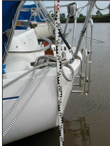
Abbildung 12: Deckshöhe achtern

Einen ähnlichen Seeunfall hat die BSU mit dem Überbordgehen des Skippers am 1. Mai 2005 auf der SY INA2 N-lich von Wustrow untersucht. Im Untersuchungsbericht 149/05, wird insbesondere auf die Problematik der Bergung von leblosen Personen aus dem Wasser eingegangen. Dabei werden Rettungssysteme vorgestellt und medizinische Aspekte des waagerechten Transportes zur Vermeidung von Herz-Kreislauf-Problemen und Unterkühlung betrachtet. Eine Bergung und Wiederbelebung führt in den meisten Fällen nur dann zum Erfolg, wenn geeignete Hebevorrichtungen und Rettungsmittel an Bord vorhanden sind. Eine nicht angelegte Rettungsweste führt zu einer schnelleren Entkräftung einer über Bord gegangenen Person, so dass diese dann nicht mehr in der Lage ist, aktiv an der Rettung mitzuwirken. Dadurch wird letztendlich das Risiko des Ertrinkens erheblich erhöht.