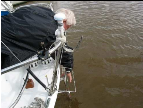
Abbildung 5: Bergungsversuch Heckkorb