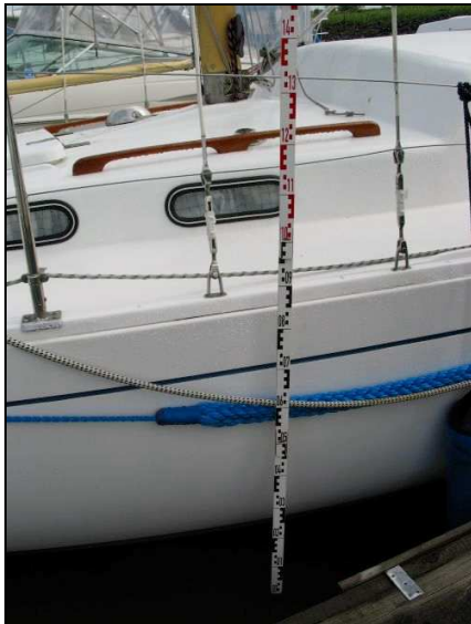
Abbildung 11: Deckshöhe Bb.-Seite

Nach den Ermittlungen der Wasserschutzpolizei und der BSU ist der Eigner und Bootsführer gegen 16:30 Uhr vor der Einfahrt Otterndorf ungesichert und ohne angelegte Rettungsweste auf der Unterelbe außenbords gefallen. Nach zwei „Mensch über Bord“-Manövern durch den Mitsegler befand sich der Verunfallte bis zur Bergung auf dem Bereitschaftsboot der HALUNDER JET ca. 1,5 Std. im Wasser. In dieser Zeit gelang es nicht, den Verunfallten durch den Mitsegler und durch zwei Besatzungsmitglieder der zur Hilfe eilenden SY LEILA an Bord zu holen. Die Rettungsaktion wurde durch den zuletzt leblosen Körper erschwert, und der Freibord von ca. 1 m Höhe ließ es nicht zu, den Körper an Bord zu heben (s. Abb. 11 und Abb. 12). Erst durch das Bereitschaftsboot konnte der Körper auf Wasserlinienniveau geborgen werden. Die danach eingeleiteten Wiederbelebungsmaßnahmen blieben erfolglos. Eine Obduktion des Leichnams wurde nicht veranlasst.