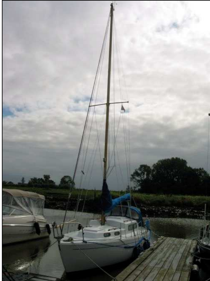
Abbildung 2: Schiffsfoto